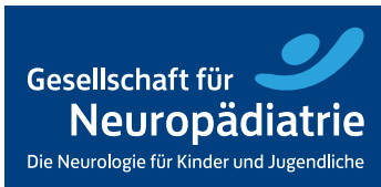
GNP_Logo_BLAU_CMYK.eps 2 hellblau-weißes Logo auf blauem Hintergrund