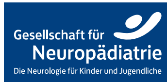
GNP_Logo_WEISSaufBLAU_CMYK.eps 2 weißes Logo auf blauem Hintergrund