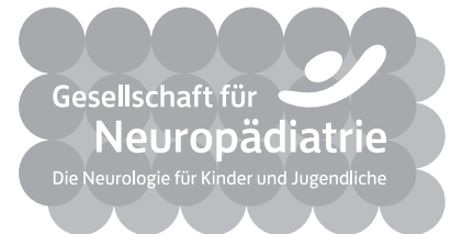
GNP_Logo_WEISS.eps 3 weißes Logo auf transparentem Hintergrund

Alle EPS-Dateien sind verlustfrei skalierbare Vektordateien, alle nicht-skalierbaren Dateitypen sollten aus diesen Dateien in den benötigten Größen heraus generiert werden (zum Beispiel JPG, PNG oder GIF).